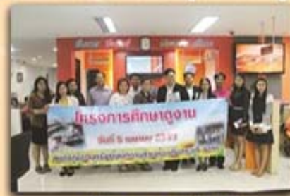
5 เมษายน 2559

สหกรณ์ออมทรัพย์พนักงานส่วนท้องถิ่นสระบุรี จำกัด