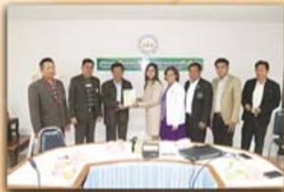
25 มกราคม 2559