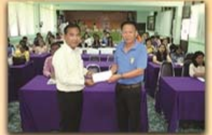
25 เมษายน 2559 บรรยายกลุ่มโรงเรียนด้านมะขามเตี้ยวิทยา