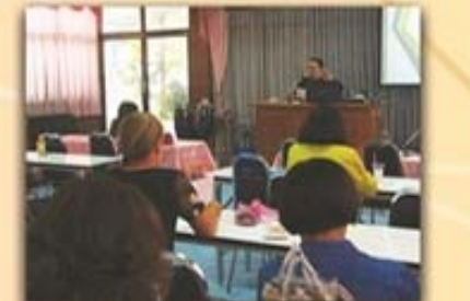
1 พฤษภาคม 2559 บรรยายกลุ่มโรงเรียนบ้านท่ามะกา