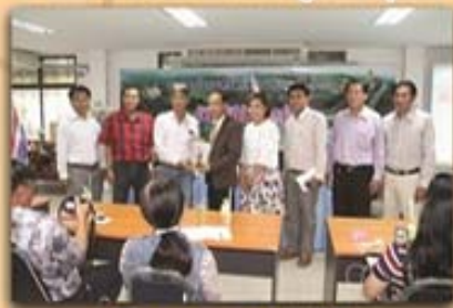
5 เมษายน 2559

สหกรณ์ออมทรัพย์สาธารณสุขจังหวัดอุดรธานี จำกัด