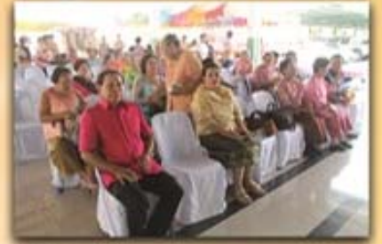
7 เมษายน 2559 เชมรมผู้สูงอายุโรงพยาบาลพลพลพยุหเสนา