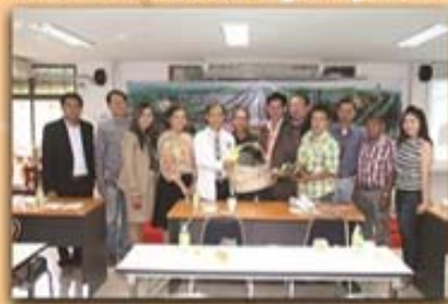
7 เมษายน 2559

สหกรณ์ออมทรัพย์พนักงานส่วนท้องถิ่นสระบุรี จำกัด