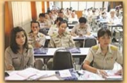
15 กุมภาพันธ์ 2559 บรรยายวิทยาสัยเทคนิคการจนบุรี