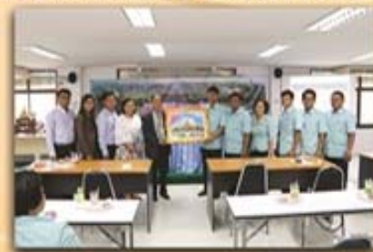
13 พฤษภาคม 2559