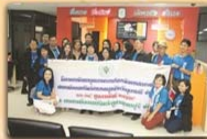
12 กุมภาพันธ์ 2559

สหกรณ์ออมทรัพย์สาธารณสุขจังหวัดอุดรธานี จำกัด