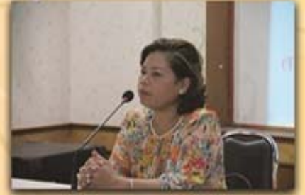
7 เมษายน 2559 บรรยายสมาชิกบ้านถาวร อ.พนมทวน